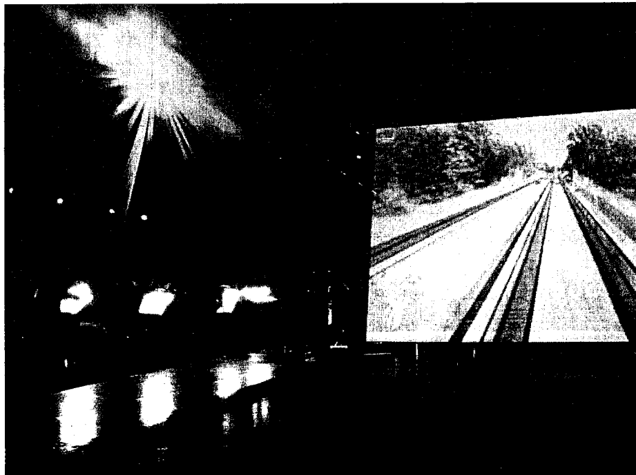
Die Musik nicht alleine gelassen: Das Thurgauer Kammerorchester verbindet Musik und Bilder in «Perception».

Weitere Vorstellungen: 29. Oktober, 20 Uhr, Eisenwerk Frauenfeld, Vorverkauf Bücherladen Sax, 052 721 66 76. 5. November, 20 Uhr, Wasserkirche Zürich, Vorverkauf Jecklin, 01 253 76 76.